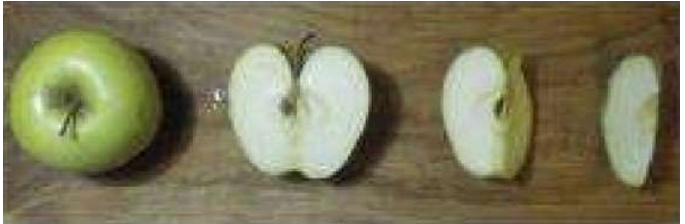
PHOTOMATH 2020, 2º Premio_ categoría A

Cette photo nous montre qu'avec de la profondeur, des rectangles parfaits deviennent des triangles parfaits et que deux éléments parallèles paraissent se rejoindre au fond de la photo.