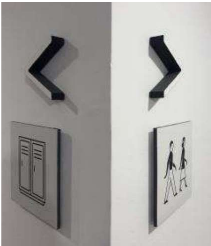
PHOTOMATH 2020, 2º Premio_ categoría B