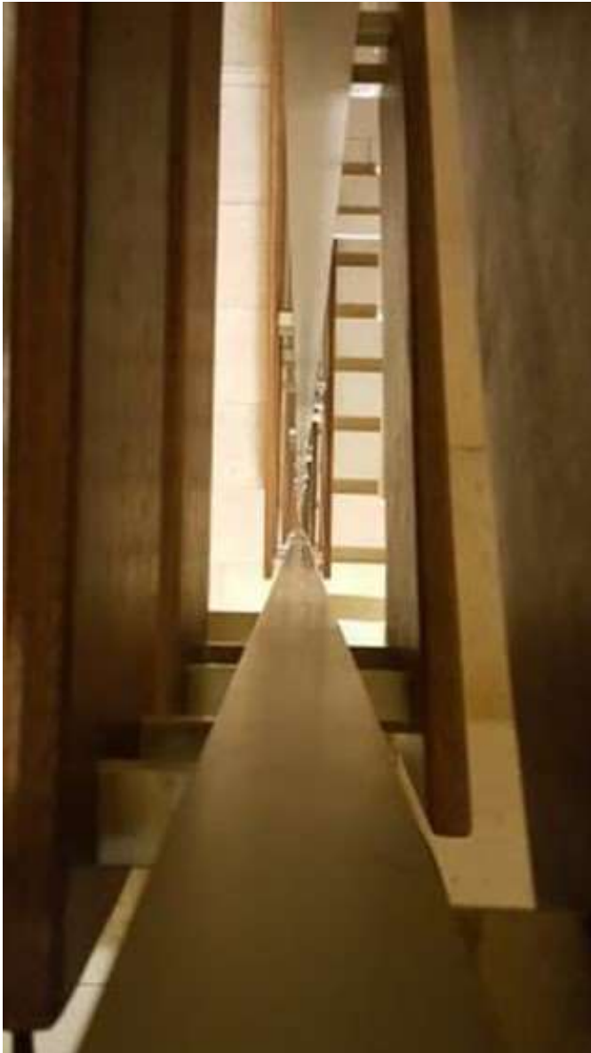
PHOTOMATH 2020, 1º Premio_ categoría A