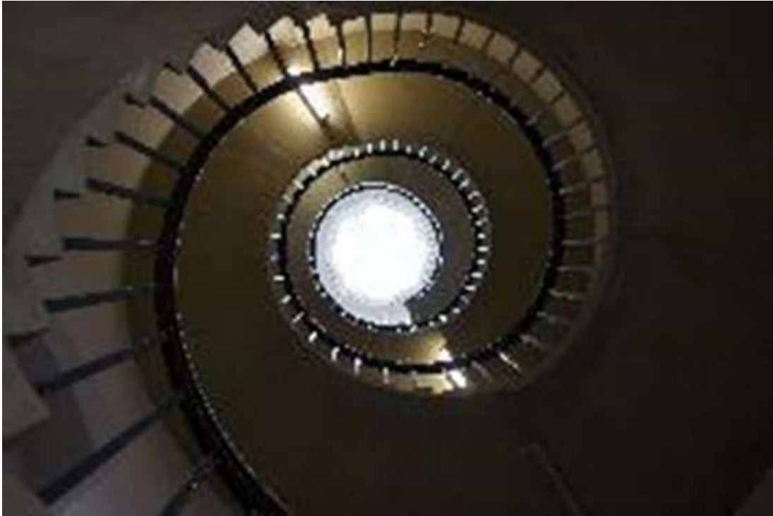
PHOTOMATH 2015, 3º Premio_ categoría A