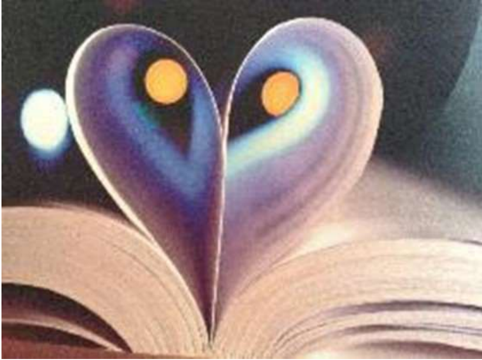
PHOTOMATH 2015, 1º Premio_ categoría A