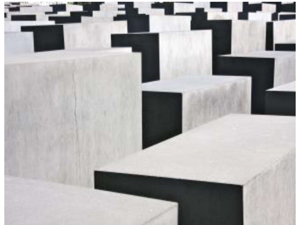
Foto realizada en homenaje a las víctimas del holocausto en Berlín