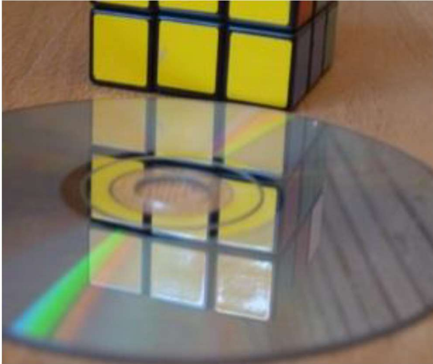
PHOTOMATH 2015, 2º Premio_ categoría B